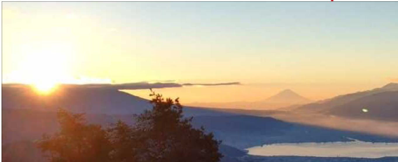
平成29年 元旦 初日の出