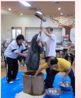
12月28日 利用者さんと一緒に餅つき