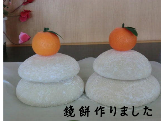
鏡餅作りしました