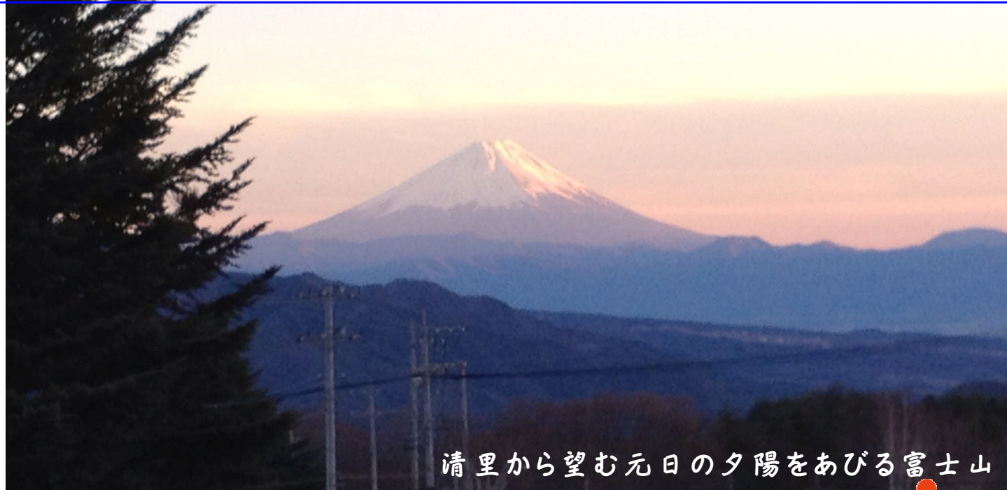
清里から望む元日の夕陽をあびる富士山