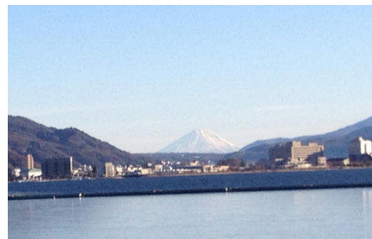
下諏訪から富士山がきれいに みえました(1日4日)