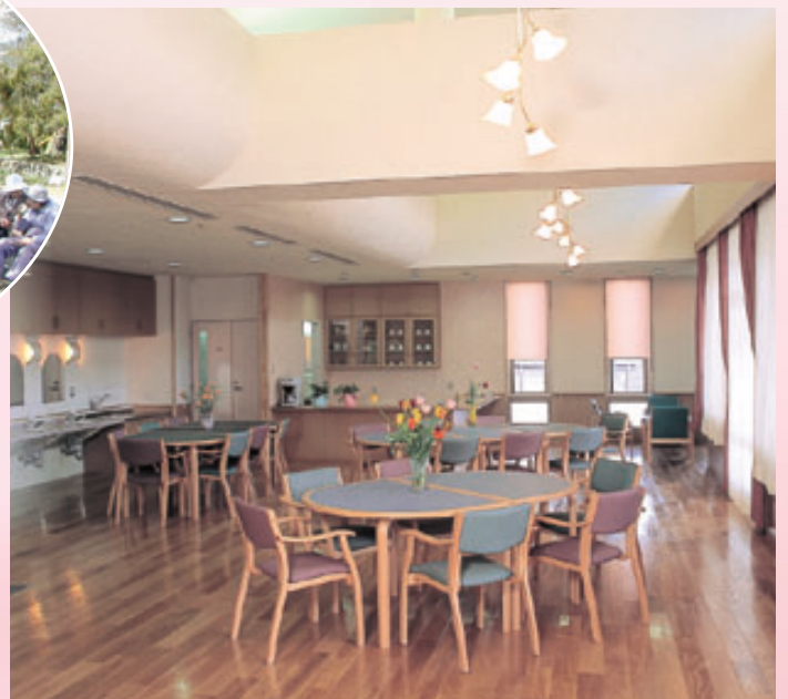
2階 短期入所施設 食堂 (ひかりの間)