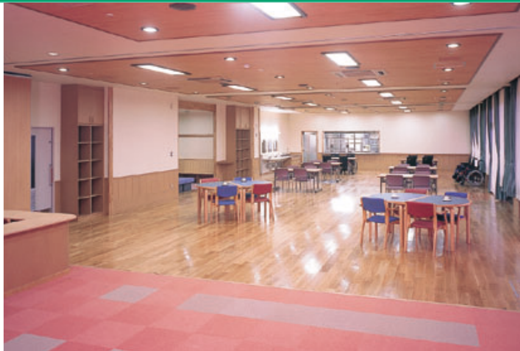
1階 デイサービスルーム (ふれあい広場)