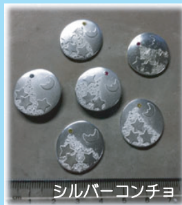
シルバーコンチョ