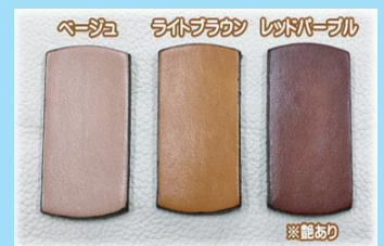
ベージュ ライトブラウン レザーカラー