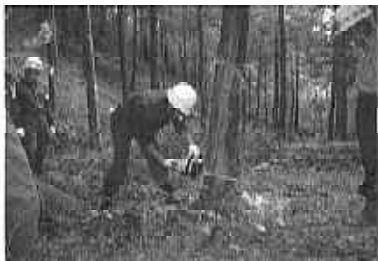
山に入って実技講習