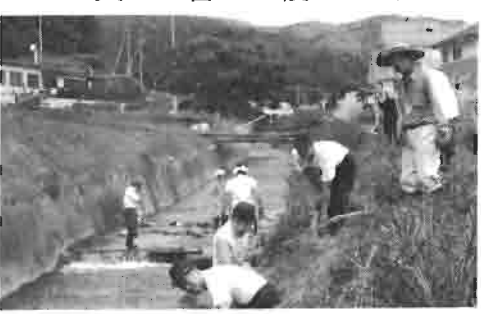
昨夏の大雨による災害復旧活動の一例です。