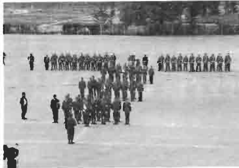
厳正なる規律を身につけ、消防精神を養い消防力を充実させる為の訓練です。