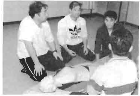
事故を防止し、緊急時に必要な手当てができるように学んでいます。