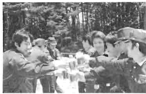
訓練の間のひとときを楽しくすごし又仲間作りの場でもあります。