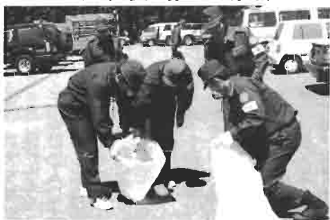
操法訓練期間中は大変お世話になりました。「感謝の気持ち」をこめてのゴミ拾いです。