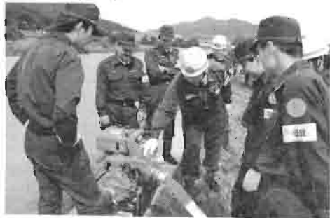
団員誰もがポンプの操作ができるように、訓練を積み重ねています。