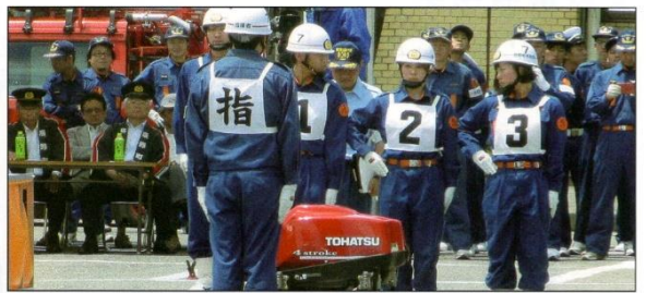
町操法・ラッパ吹奏大会の様子です。本年度も第七分団との合同チームで参加しました。

平成三十一年の輝かしい新春を迎え、三区の皆様にご挨拶を申し上げます。三区の皆様におかれましては、日頃より消防団活動に対し、深いご理解とご協力を賜り厚く御礼申し上げます。 昨年を振り返りますと、当分団管内において二件の火災が発生してしまい、決して平穏な一年にはなりません。活動の際には多くの区民の皆様にご協力を賜り、感謝申し上げます。今後も予防消防に努めてまいりますので、引き続き皆様のご協力をお願い申し上げます。 また、第七分団と合同で挑みました第五十六回町ポンプ操法・第四十回町ラッパ吹奏大会において、ポンプ車操法の部で「優勝」を果たすことができました。これは区民の皆様のご援、諸先輩方の指導の元、両分団が一致団結して出した結果であり、このことを皆様に報告できることをとても嬉しく思います。昨年の結果に満足することなく、本年も引き続き訓練に励んでまいります。 ところで、昨年、新しい澤底屯所が無事完成し、六月十日に竣工式を実施出来ました。 これもひとえに区民の皆様や関係者皆様のご支援、ご尽力の賜物と感謝申し上げます。屯所や車輛・装備等の充実に私たち消防団員の技量が劣らない様に、様々な活動や訓練を通じて各個人の技能や知識向上に努めてまいります。しかしながら、消防団員だけでは地域防災を築くことは難しく、区民の皆様との協力体制をより強固にして、火災や災害に備えたいと思いますので、本年もご協力をお願い申し上げます。 結びに三区の益々のご発展並びに区民の皆様のご繁栄とご健康をお祈り申し上げます。本年が災害のない穏やかな年であることを祈りながら新年のご挨拶とさせていただきます。