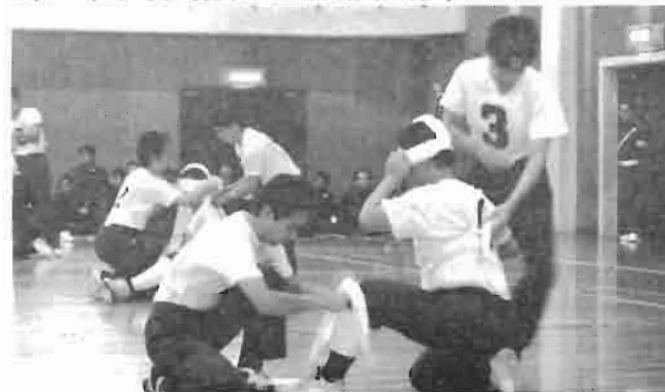
いかに速く適切な処置が出来るかを競います。