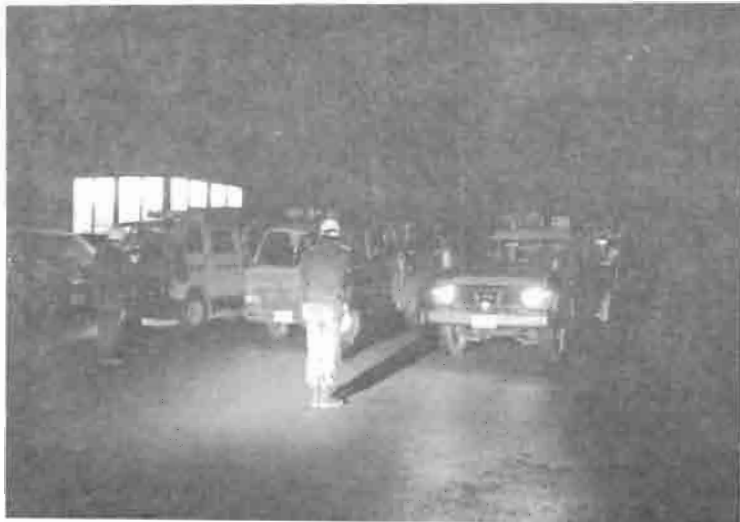
町民が安心して新しい年を迎えられるよう 年末も消防団は日夜がんばっています。