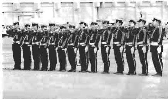
県ラッパ吹奏大会 緊張の中ラッパを持つ手が震える。