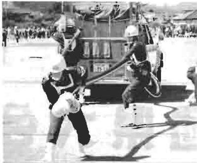
県大会 長さ8m息を合わせて吸管伸長。