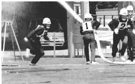
町大会 第2線延長、0コンマ1秒を追いかけろ!!