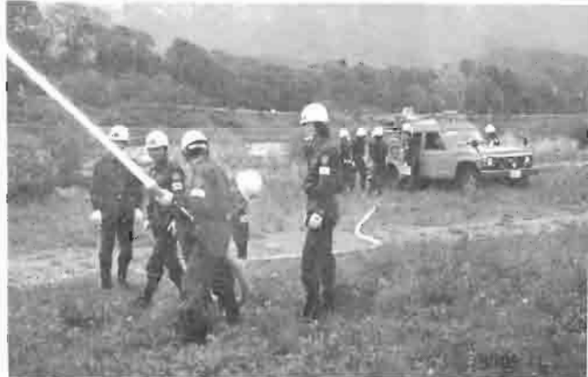
団員誰もがポンプ操作出来るよう 訓練を積み重ねています。