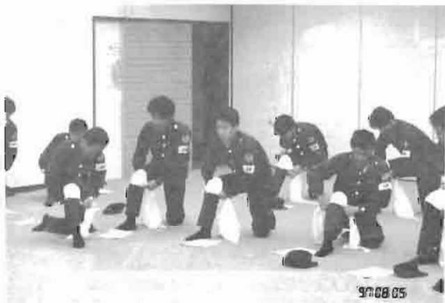
三角巾を使用して止血をしているところです。