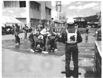
町大会 激戦区の町大会本番前 円陣を組み、オー！