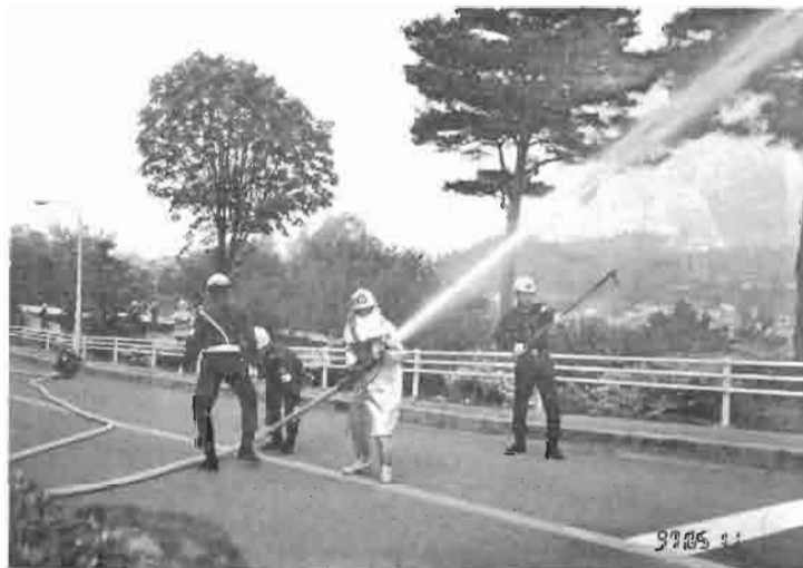
「豊南短大にて」高低差に対処する為の ポンプ中継の訓練です。