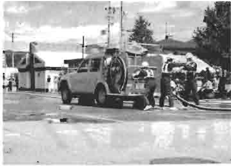
町大会 筒先、ホースを持つ手が震える。 あわてず、あせらずタイムを縮める。