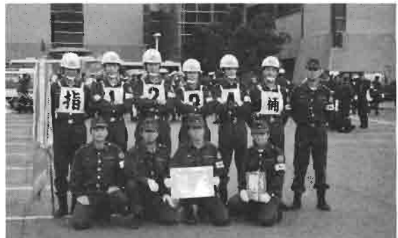
郡大会 豪雨の中でのうれしい優勝