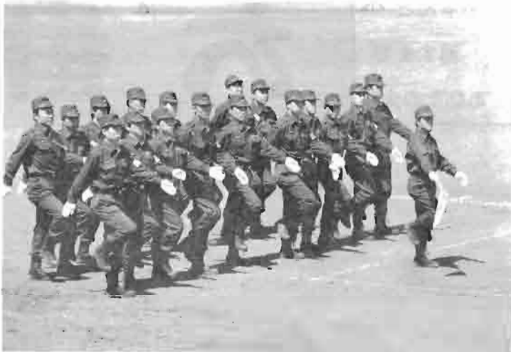
規律正しい訓練を通じて消防精神が研かれていきます。