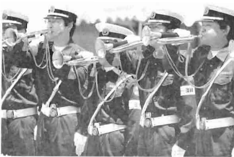
辰野のラッパは郡下一澄んだ音色です。