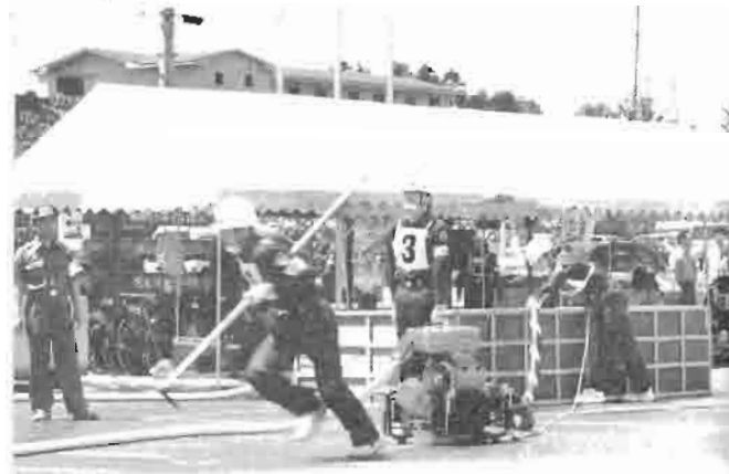
勝負は時の運、君たちも自動車に負けない位熱かっ