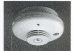
住宅用火災警報器

日本でも住宅火災による犠牲者を減らすために消防法が改正され、全国一律に住宅用火災警報器の設置が義務付けられました。