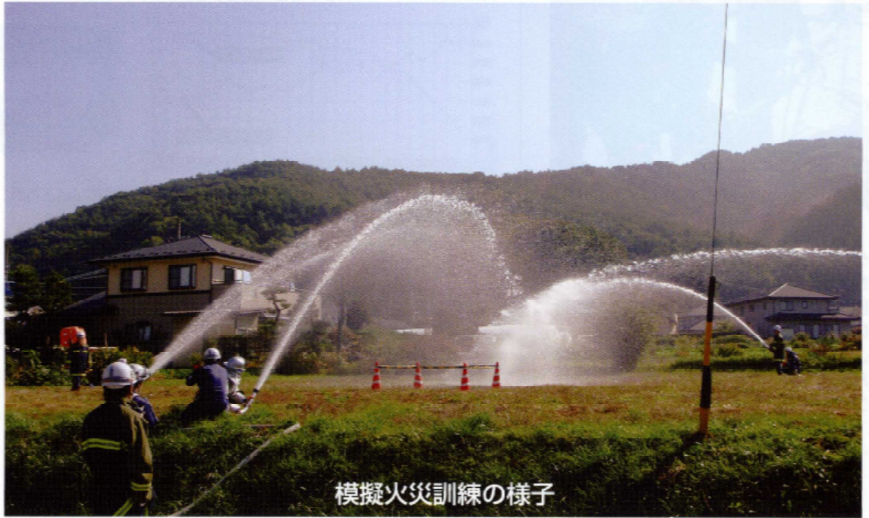
模擬火災訓練の様子