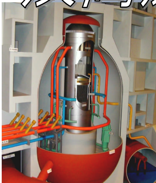
無数の配管が走る巨大な原子炉（模型）

大震災後「世界で最も危険な原発」中部電力浜岡原発が運転停止となり、現在1000億円の津波対策を講じて2013年1月に運転を再開する工事が進行しています。