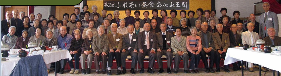
第2回ふれあい昼食会in山王閣