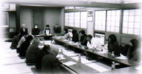
じっくり話し合い3役選出。懇親会へ♪ 30町内

現在「町内一行事」「ささえあいマップ」を推進、展開しています。 その中で、『町内推進会』の設置を進めています。 町内会長を中心に隣組長・町内役員・区会議員・民生児童委員・町内有志の方々の力をお借りして「誰もが安心して暮せるまち」を目指しましょう！