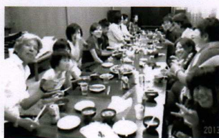
勝利目指して親睦会 7町内