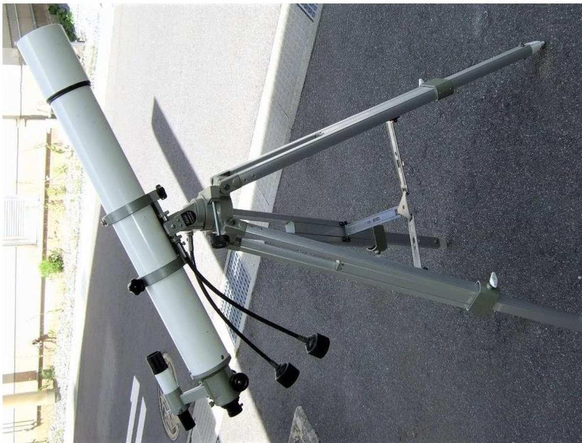
④ ペンタックス PENTAX-J80 口径 80mm 焦点距離 1000mm アクロマート屈折望遠鏡 木脚をアルミ製脚に交換して使いやすくやっています。フードにへこみ有、蓋がないです。 写真ではファインダーがついていませんが、付いています 1台